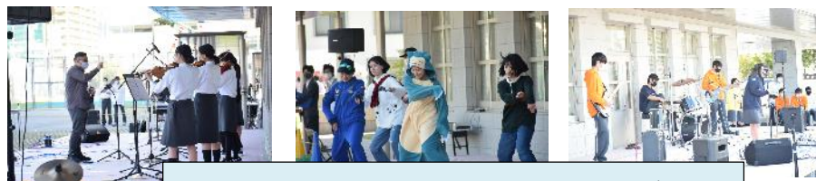
野外に設営された舞台での様々なステージ発表