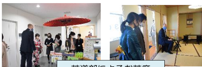
茶道部によるお茶席