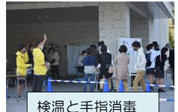
検温と手指消毒をしての受付

今年度の学園祭は、入場制限を設けてなんとか開催にこぎつけました。様々な多くの学校行事が中止となる中で、生徒たちの思い出に残るようなイベントになったのではないのでしょうか。