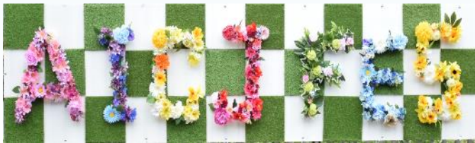
校内装飾の生徒たちが作った玄関前の看板

今年度の学園祭は、入場制限を設けてなんとか開催にこぎつけました。様々な多くの学校行事が中止となる中で、生徒たちの思い出に残るようなイベントになったのではないのでしょうか。