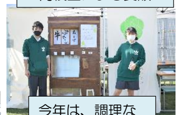
今年は、調理なしで、全てパッケージされたものを販売