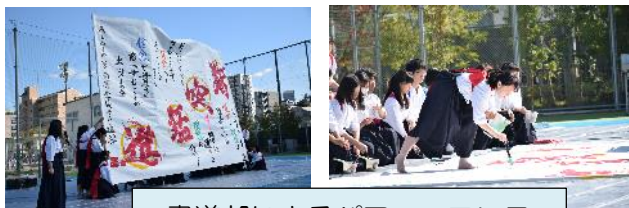
書道部によるパフォーマンス