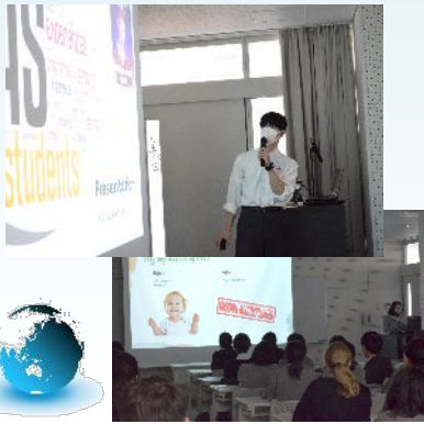
Final終了後に行われたCASの英語プレゼンテーションの様子

11月Final Exam (世界共通テスト)が10月27日から3週間に渡る日程で始まりました。今年度は、新型コロナウイルス感染拡大に伴い、5月Final Examが中止となり、本校のIB生が受験する11月も、一時は実施が危ぶまれていましたが、無事全試験日程を終了することができました。長期間に渡り、プレッシャーと戦ってきたIB12の受験生のみなさん本当にご苦労様でした。最終結果は、新年早々に判明します。国内進学コースのみなさんも、共通テストに向けて健康管理に留意しながら頑張ってください。