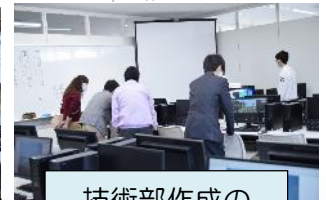
技術部作成のゲームの展示