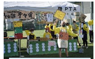
高校生による食販