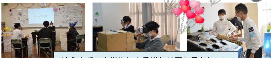
校舎内での中学生による様々なアトラクション