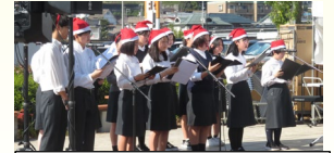
クリスマス点灯式 で合唱する生徒

イオンモール広島祇園さんからは、年間を通してJazz部や書道部など本校の多くクラブの日ごろの活動を披露する機会を与えて頂いています。ありがとうございます。