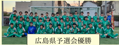
広島県予選会優勝

≪広島県予選会≫ 優勝 準決勝： 9 vs 0 広島皆実 決勝： 7 vs 1 山陽 ≪中国地域予選会≫ 準優勝 1回戦： 16 vs 0 長門 準決勝： 11 vs 0 山陽 決勝： 0 vs 1 高川学園