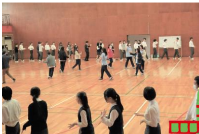
体育館でのアイスブレイク

以前本校の高2がオンライン交流をしたタイの学校から9名の生徒さんが来校してくれました。交流会では、互いの国の遊びを共に体験してアイスブレイクをし、その後、授業にも参加。午後からは有志の生徒たちが平和公園、資料館を案内して回りました。広島やAICJを知ってもらうことができたのではないかと思います。海外の同世代と仲を深め合うことができたことを喜んでいました。