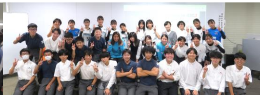
楽しいひとときを過ごしたあと参加者全員で記念写真