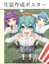
生徒作成ポスター