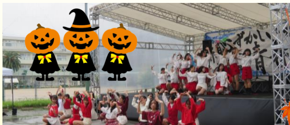
野外特設ステージダンス部パフォーマンス

一般公開日は生憎の雨となり予定変更も余儀なくされましたが、生徒会を中心に臨機応変に対応してくれました。1700名を超えるお客様にご来場いただきました。PTAの保護者の方々もご協力ありがとうございました。