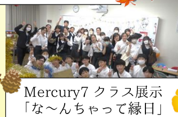
Mercury7 クラス展示「な〜んちゃって縁日」