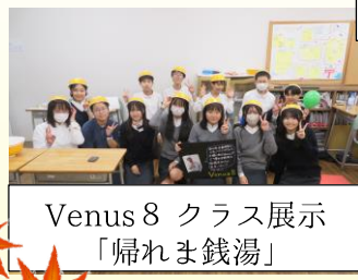
Venus8 クラス展示「帰れま銭湯」