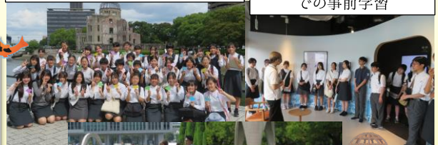
外国人観光客へのインタビューの様子