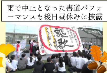
雨で中止となった書道パフォーマンスも後日昼休みに披露