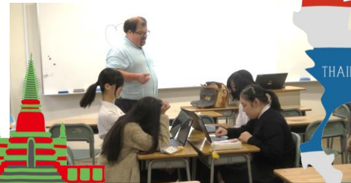
英語の授業を共に受ける様子