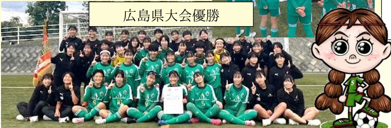
今年こそは、神戸ノエビアスタジアムの決勝ピッチで!!

今年度から原則県大会の優勝校が全国大会への出場権を得るルールへ変更となりました。広島県大会では、5連覇を達成することができました。これで6年連続で全国大会へとコマを進めますが、今年は、なんとか全国ベスト8の壁を越えて、次へのステップを踏んでほしいと思います。応援しています。