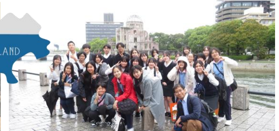
平和公園で原爆ドームを背景に