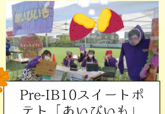
Pre-IB10スイートポテト「あいびいも」