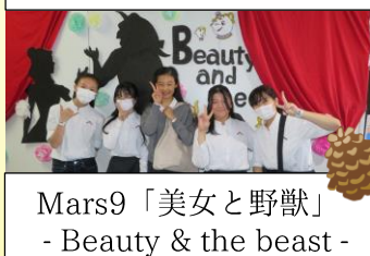
Mars9「美女と野獣」 - Beauty & the beast -