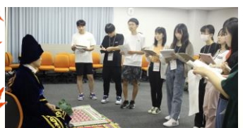
ユースJICA海外協力隊として派遣される設定でヒアリングをする様子