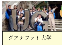
グアナファト大学