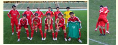
先取点を取った瞬間(右)

皇后杯JFA第46回全日本女子サッカー選手権が一足先に、栃木県グリーンスタジアムにて行われました。皇后杯本選への出場は初めてで、全国でも高校チームは4校のみの出場でした。東京国際大学との初戦に延長まで戦い抜きましたが、惜しくもPKで涙をのみました。大きな経験となりました。冬の選手権への布石となることを願ってやみません。遠方まで応援にお越しいただいた保護者の皆さんありがとうございました。